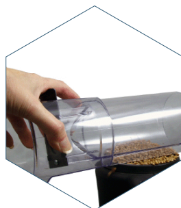
3. Nivele el grano