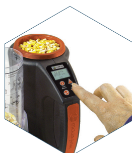
4. Pulse el botón, resultados en segundos