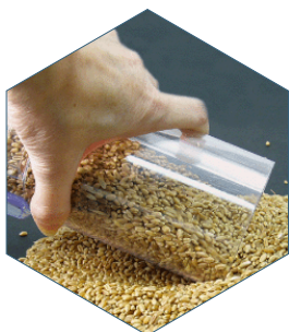
1. Llene el cargador

** Incluido solo en modelos seleccionados