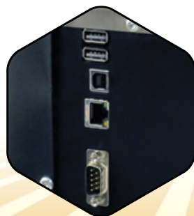
Múltiples puertos USB posteriores