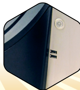
Puertos USB frontales de fácil acceso