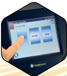
Pantalla intuitiva táctil a color