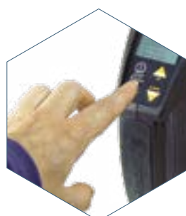
4. Taste drücken, ergebnisse in sekunden