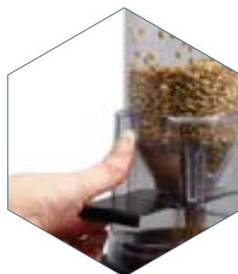
2. Ladegerät in analysator entleeren