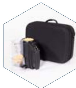
mini GAC™ Plus mit tragetasche