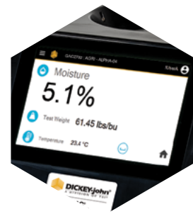
Pantalla de resultados de fácil lectura