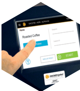
Pantalla táctil en color intuitiva

Al comprar un DICKEY-john GAC™ 2700-AGRI obtendrá toda la fiabilidad y el valor que espera de los productos DICKEY-john®. Al igual que todos los productos DICKEY-john, el GAC 2700-AGRI está diseñado y fabricado en los EE.UU., y apoyado en todo el mundo.